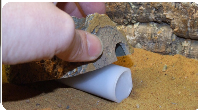
De Mite Booster® voor het uitzetten van Dutchy's®

Dutchy's® zijn roofmijten, zij eten mijten en andere parasieten. Voor de ontwikkeling van de jonge roofmijten en de eieren, dienen zij een omgevingstemperatuur te hebben die boven de 15 °C is.