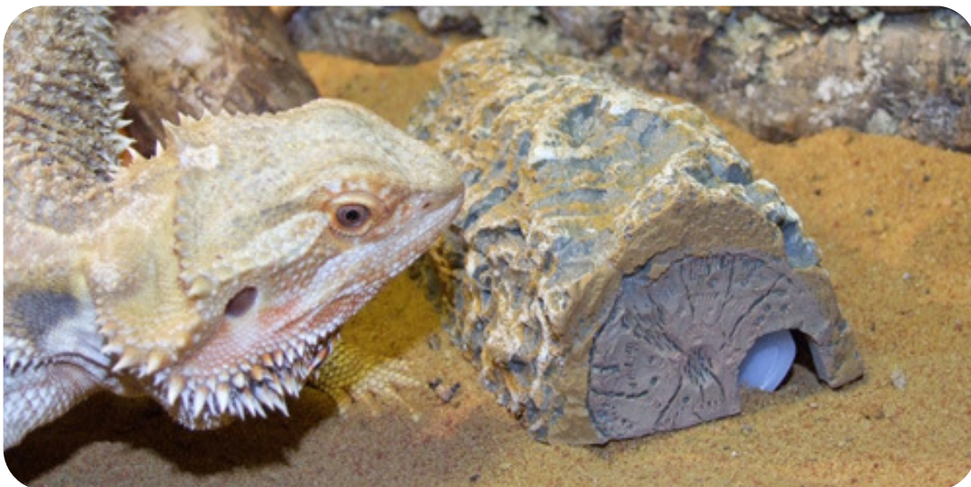
Hier ligt het Mite Booster® patroon onder het stronkje, zodat het patroon gecamoufleerd is. De Dutchy's kunnen eenvoudig in en uit het patroon lopen door het gaatje in het patroon en de opening in het stronkje.

Leg het Mite Booster® patroon op zijn afgeplatte zijde op de bodem van het terrarium. Om de Mite Booster te laten opgaan in de natuurlijke achtergrond van uw terrarium kan hij worden bedekt met een speciaal polystone stronkje. Deze is ook bij Refona te koop.